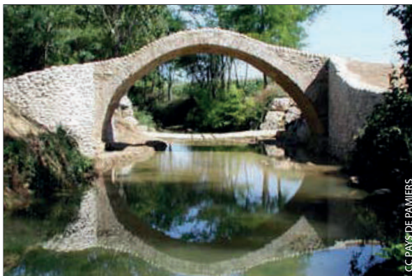
Pont de Riveneuve, Pamiers (Ariège)