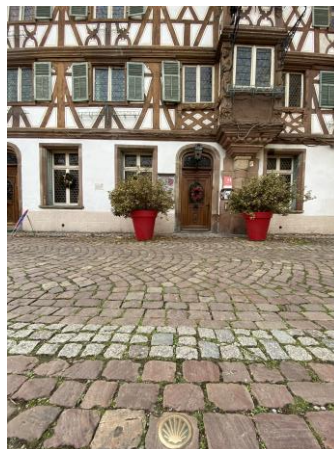
Le village médiéval de Turckheim en Alsace