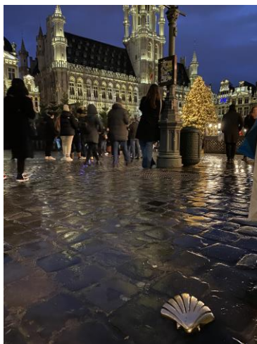
Bruxelles, La Grande Place

Depuis 2015, à l'initiative de l'Église de France et grâce au soutien et aux moyens mis en œuvre par l'Archevêque de Santiago, un accueil des pèlerins