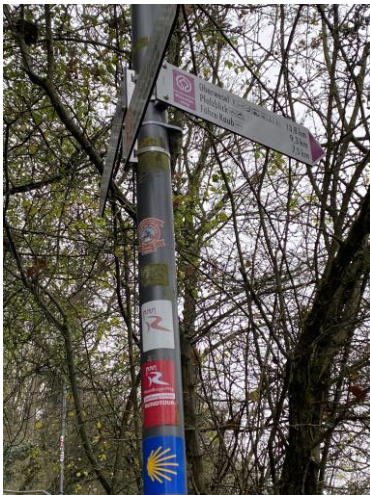
Bacharach, Vallée du Rhin en Allemagne