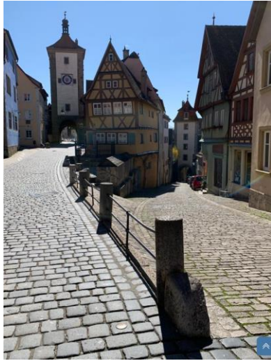
Rothenburg ob der Tauber Allemagne 1 (Un pavé du bas)