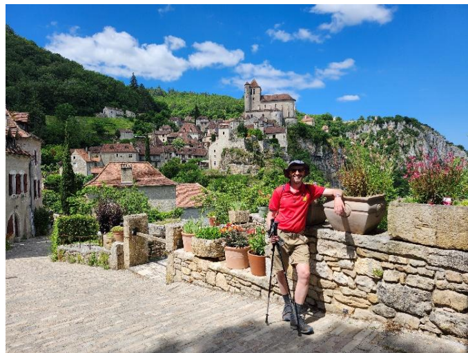
Le village de Saint-Cirq Lapopie

Les formalités du billet réglées, nous entreprenons la descente vers le Lot par paliers, en nous arrêtant d'abord à l'église . Brûler quelques lampions pour ses chers disparus fera le plus grand bien à Dorothée. C'est à ces moments qu'on apprécie les lieux de cultes préservés.