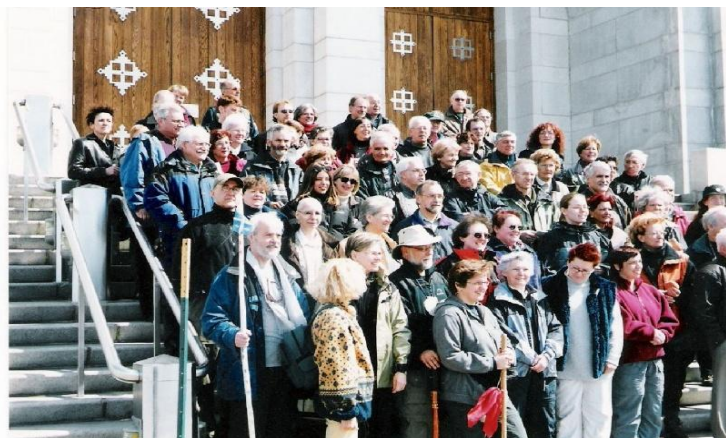
Le premier Coup d'envoi au Cap de la Madeleine en 2001

À partir de la troisième année, les organisateurs attribuaient un thème au Coup d'envoi. Voici les endroits où s'est déroulé l'événement entre 2001 et 2007 ainsi que les thèmes adoptés. 1