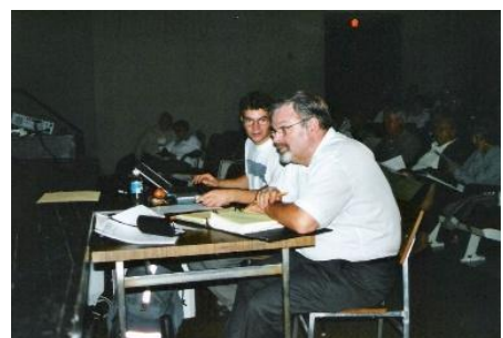
Photos du premier Grand rassemblement à Québec