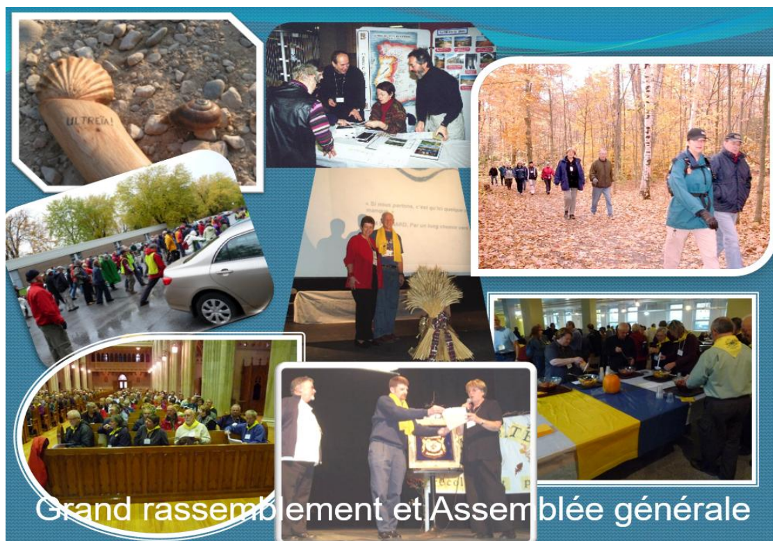
Grand rassemblement et Assemblée générale