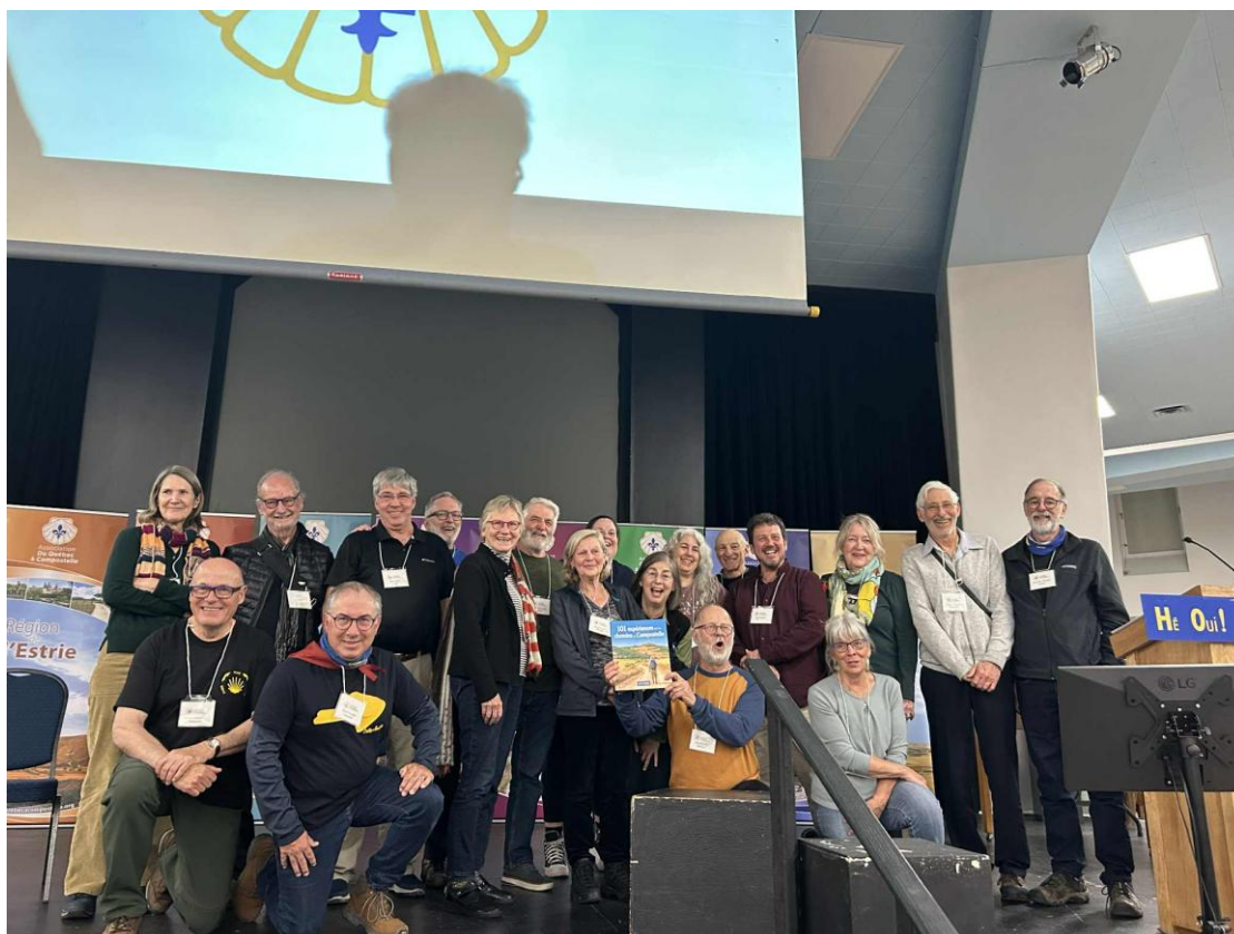
Un total de 19 des 27 participants au projet de publication lors du lancement au Grand rassemblement 2025.

Au total, 27 membres ont collaboré au projet d'écriture et d'illustration et, lors du lancement, 19 d'entre eux se sont rencontrés pour la première fois. Inutile de mentionner que l'ambiance était à la fête. Pour visionner la présentation faite au Grand Rassemblement : https://youtu.be/rj4Gu7mgKn8