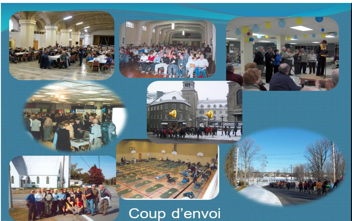
Source : Montage présenté à l'occasion du quinzième anniversaire en 2015