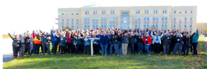
Un souvenir du Grand Rassemblement alors qu'il se déroulait au Faubourg Mont-Bénilde