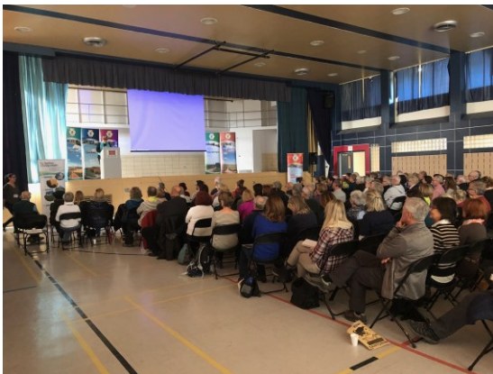
Une Assemblée générale « non virtuelle » L'époque avant la pandémie

C'est simple, vous n'avez qu'à cliquer sur le lien ci-après pour vous rendre directement sur le portail d'inscription du site web de l'association. Cliquez ici pour vous inscrire à l'assemblée générale 2022