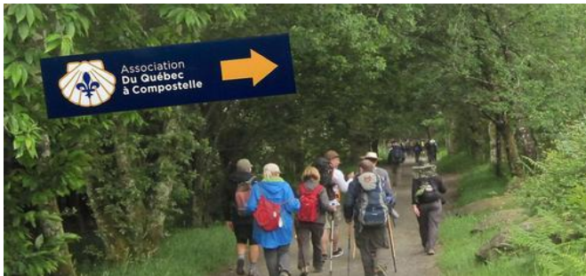
Sur la route du Mitan

Depuis plusieurs années, l'équipe d'animation de la région de Québec organise en octobre la « Marche du Mitan ». Il s'agit d'une route qui traverse l'île d'Orléans du nord au sud qui est, pour l'occasion, parcourue aller-retour pour une distance totale de 16 kilomètres.