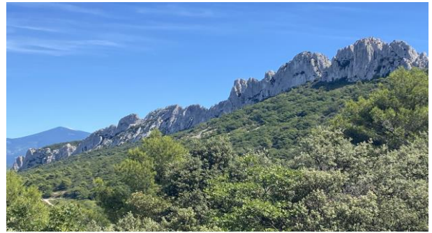
Les dentelles de Montmirail dans les Alpilles

Section "Culture" de Saint-Jacques Alpilles à Salon-de-Provence